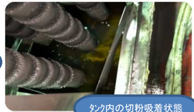
タンク内の切粉吸着状態