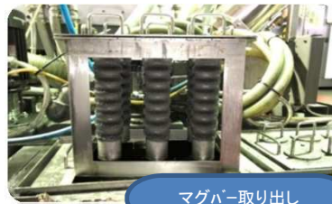
マグバー取り出し