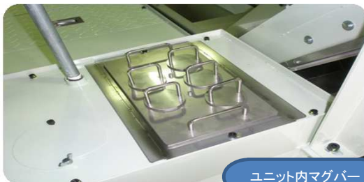
ユニット内マグバー