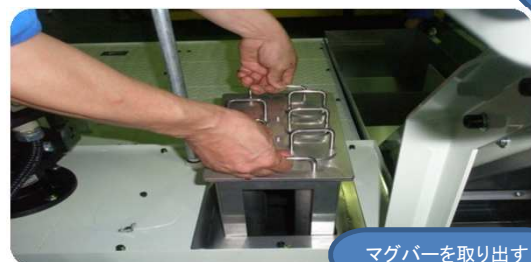
マグバーを取り出す