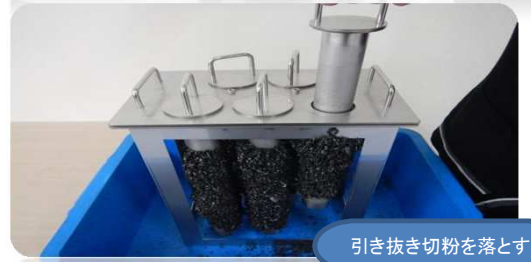
引き抜き切粉を落とす